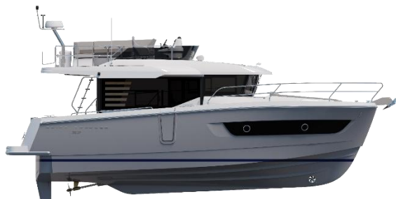
Profil Coque Signal Grey - Flybridge