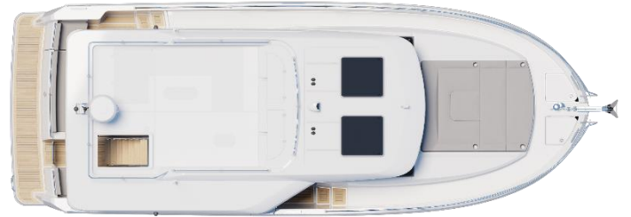
Sedan - Option panneaux ouvrants