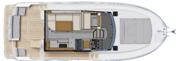
Pont principal - Option banquette coulissante