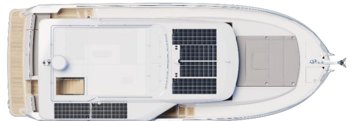
Sedan - Option Silent boat