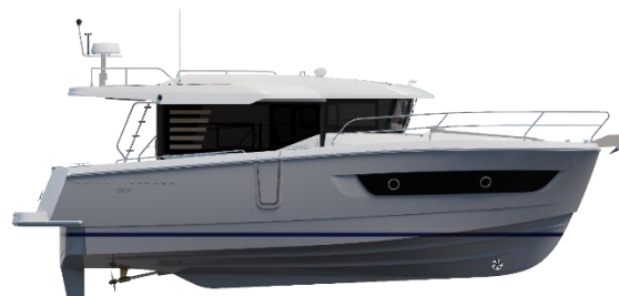
Profil Coque Signal Grey - Sedan